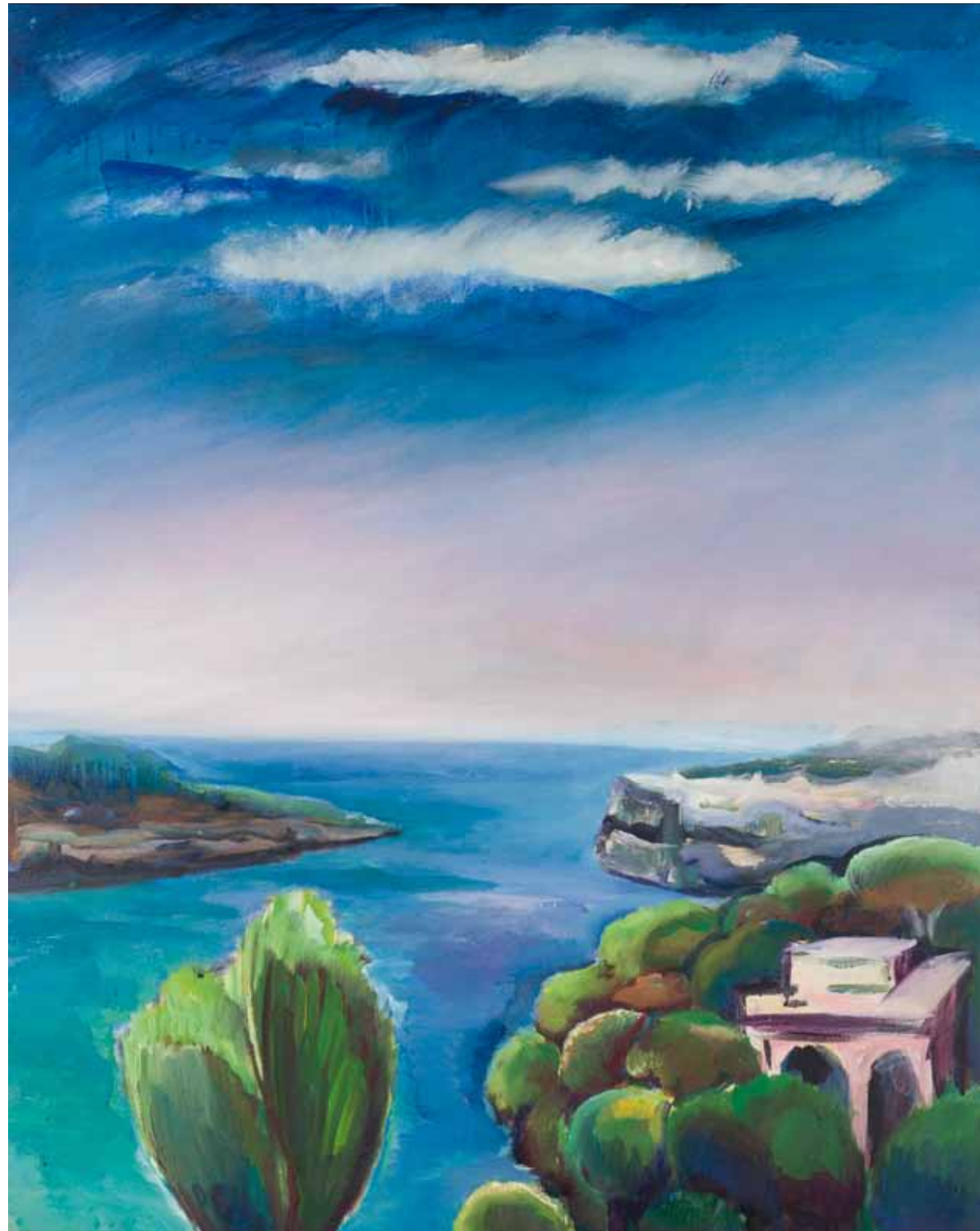
TRAUM VON MALLORCA , 1987 Mischtechnik auf Leinwand 100 x 80 cm