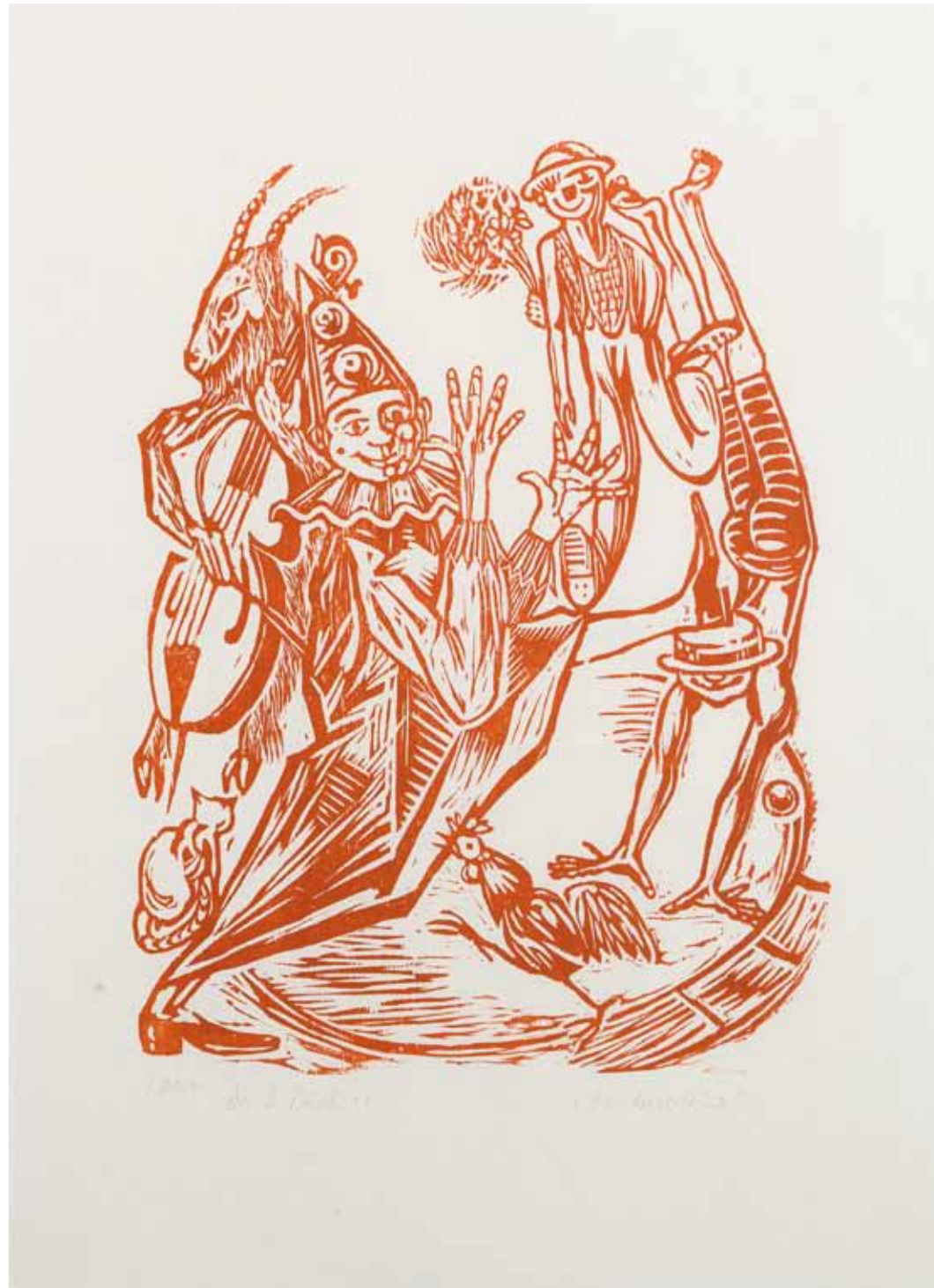
KINDERZIRKUS , 1977 Holzschnitt 45,5 x 35,5 cm