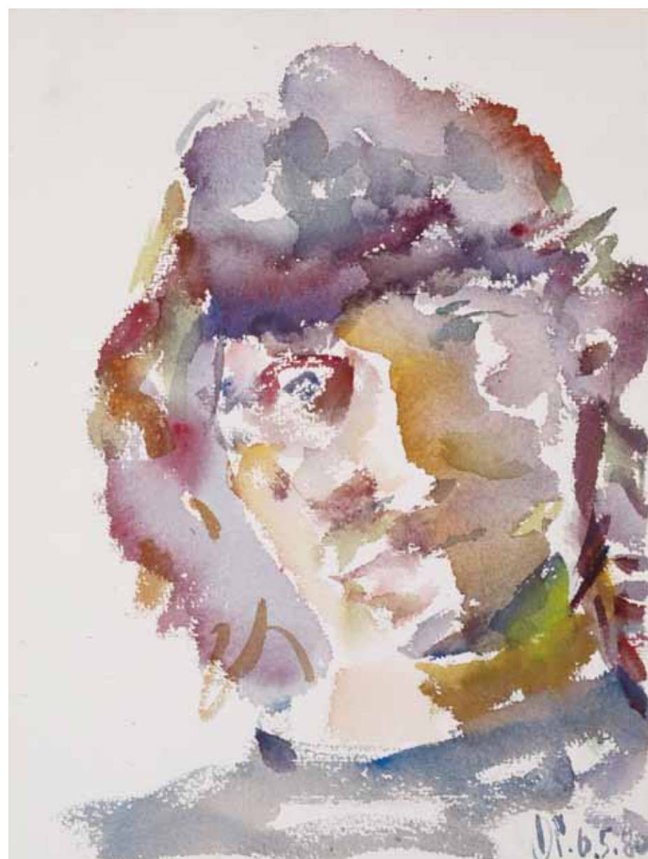
SUSANNE , 1980 Aquarell 47 x 35,5 cm