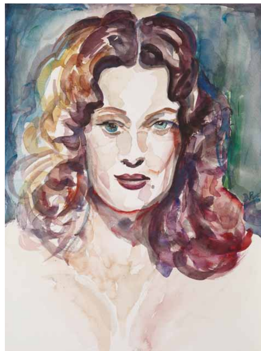
LYDIA , 2006 Aquarell 40 x 30 cm