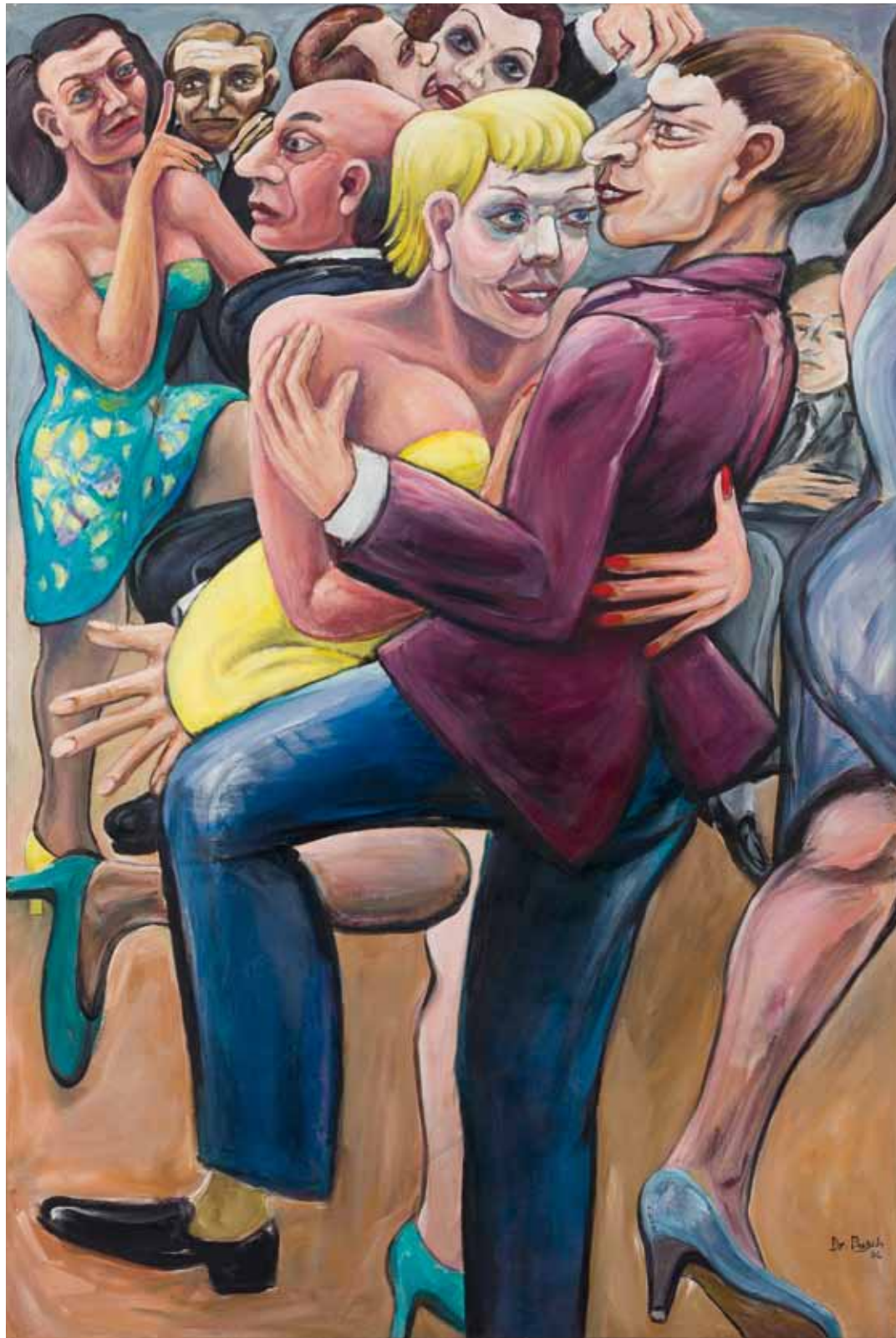
Ü30-TANZVERGNÜGEN , 2006 Mischtechnik auf Leinwand 120 x 80 cm