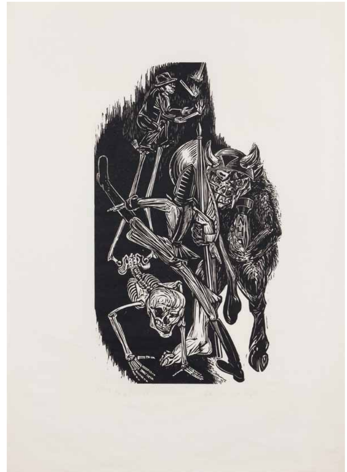
RITTER, TOD UND TEUFEL – DER KALTE KRIEG , 1978 Holzschnitt 78 x 58 cm