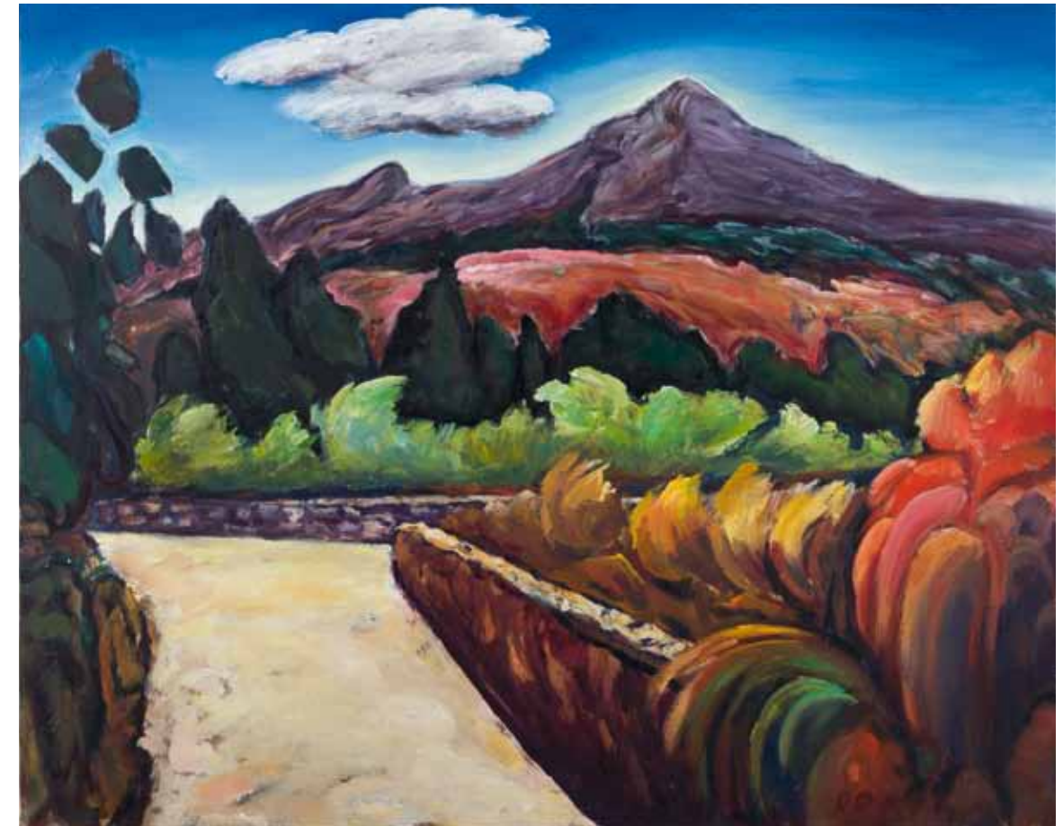
STUNDE DES PAN , 1986 Mischtechnik auf Leinwand 60 x 80 cm (in Privatbesitz)