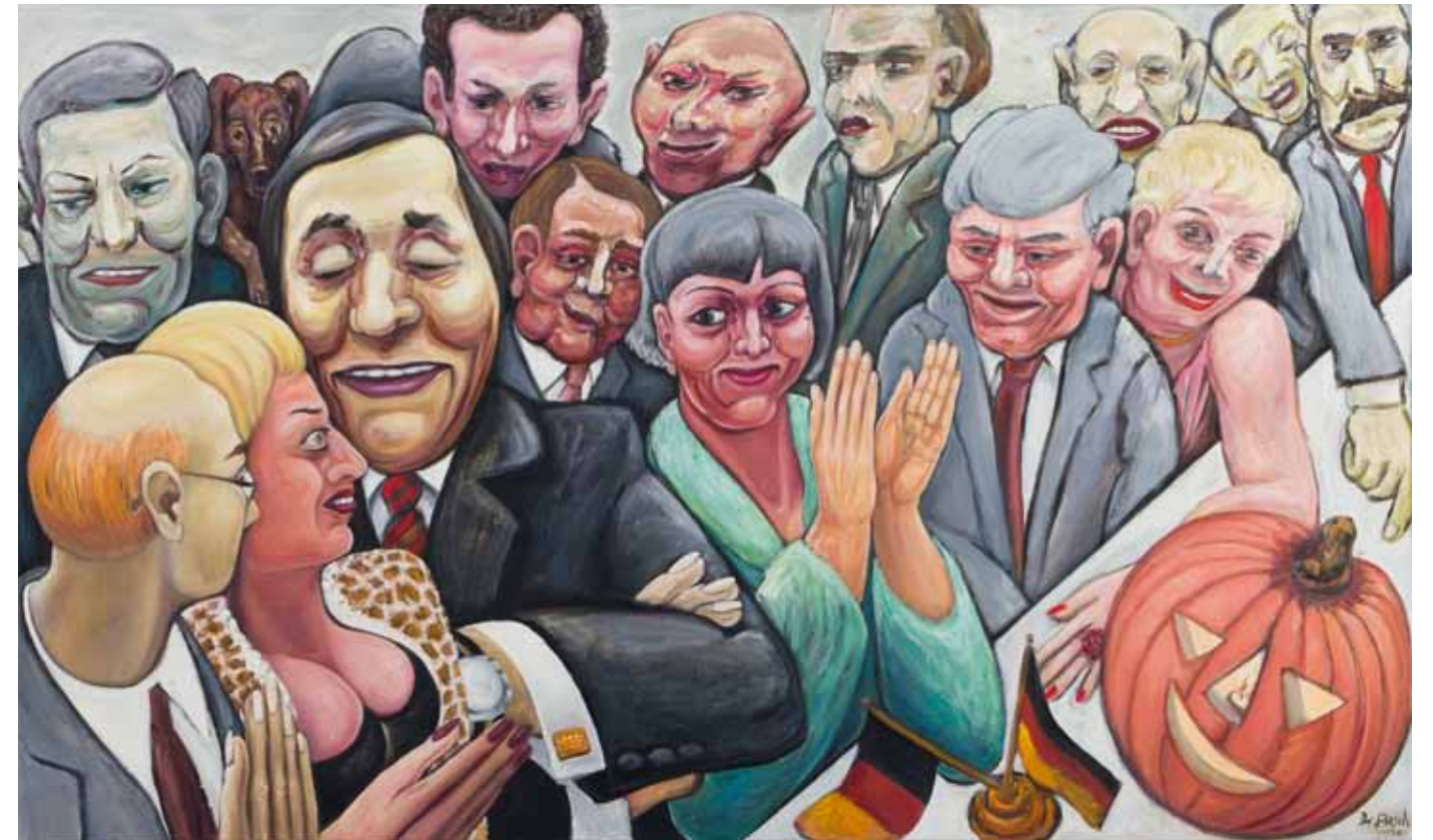
UM DEN GROSSKOPFERTEN HERUM , 2006 Mischtechnik auf Leinwand 60 x 100 cm