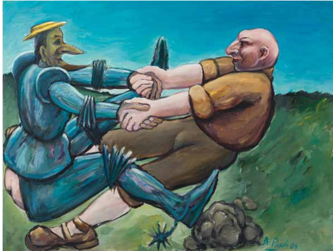
DON QUICHOTE, HILFREICHER SANCHO , 2004 Mischtechnik auf Leinwand 60 x 80 cm