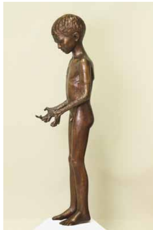
WIR SIND'S DIE IHR BESIEGT HABT, TRIUMPHIERT (B. Brecht: Kriegsfibel ), 1973 Höhe 122 cm Museum der Bildenden Künste Leipzig Militärhistorisches Museum der Bundeswehr Dresden