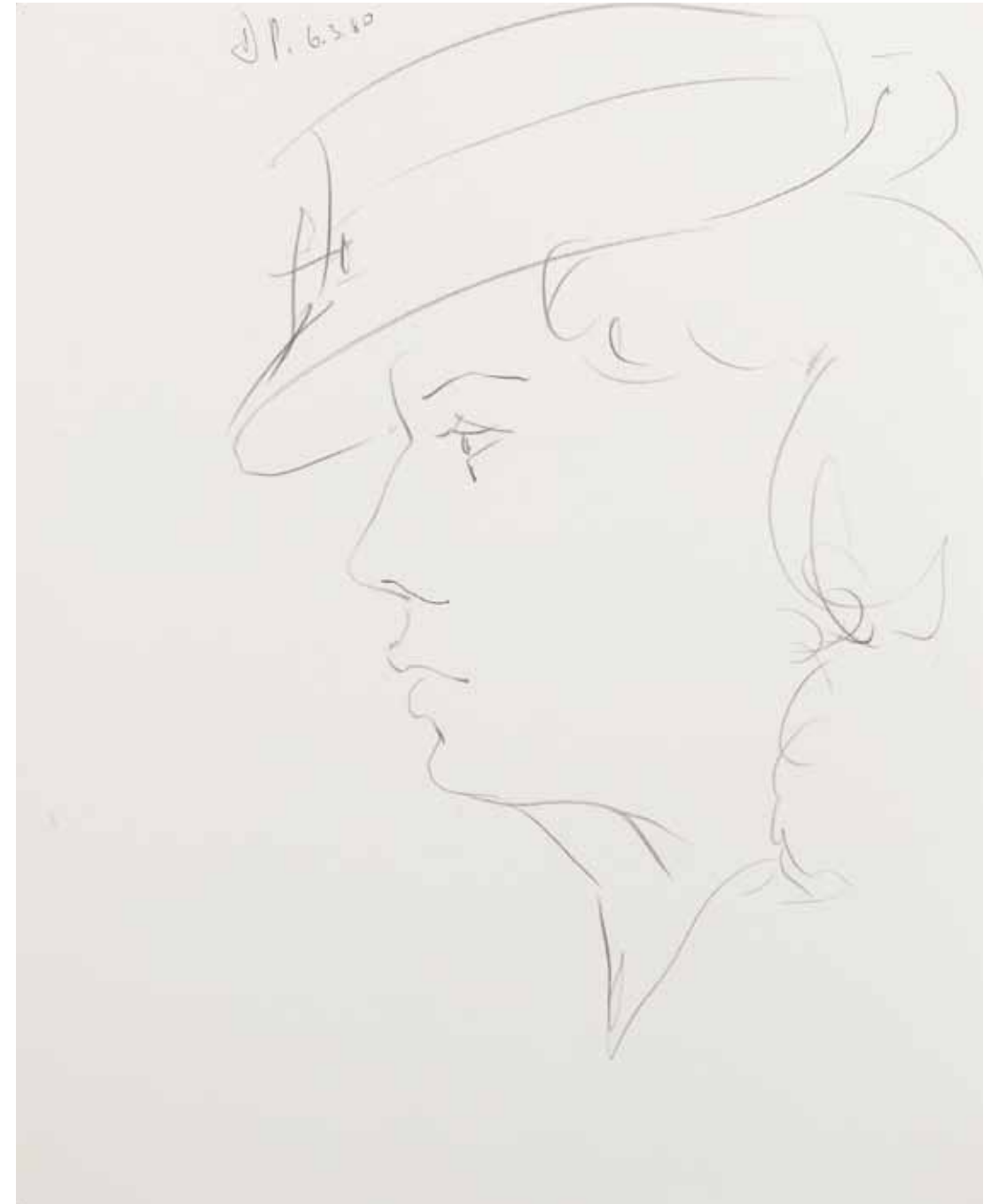
UTE MIT HUT , 1980 Bleistift auf Papier 60 x 42 cm