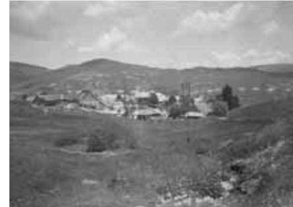
Abb. 1 Anonym: Blick auf Bernau, ca. 1885, Städel Museum, Frankfurt am Main