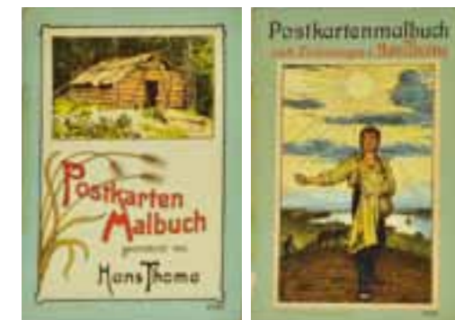
Abb. 1 Hans Thoma: Postkartenmalbücher, Städel Museum, Frankfurt am Main

Anonym: Hans Thoma , 1905, Städel Museum, Frankfurt am Main