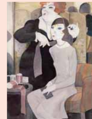
Abb. 4: Jeanne Mammen, Der neue Hut, 1929, Staatsgalerie Stuttgart