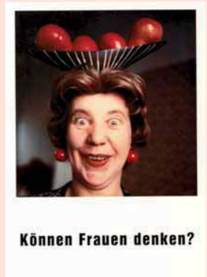
Abb. 1: Anna Blume, Können Frauen denken?, 1982

Der betulichen Gefährtin, die Teil eines sorgsam möblierten und dekorierten, tödlich engen Mikrokosmos ist, der ihrer Kontrolle entgleitet und sie