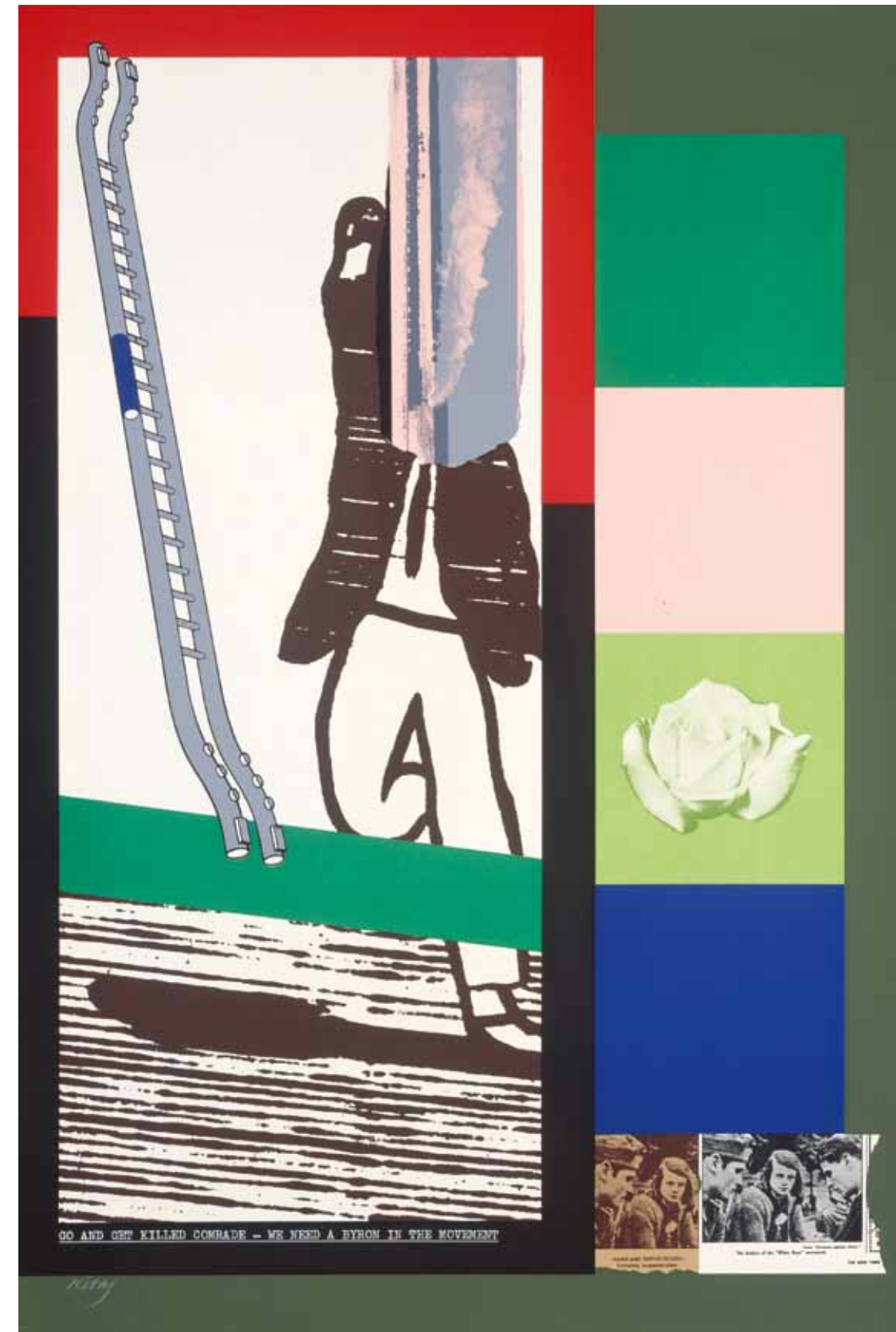
RONALD B. KITAJ What is a Comparison? 1964–67 (Kat. 35) RONALD B. KITAJ Go and Get Killed Comrade – We Need A Byron in the Movement 1964–67 (Kat. 34)