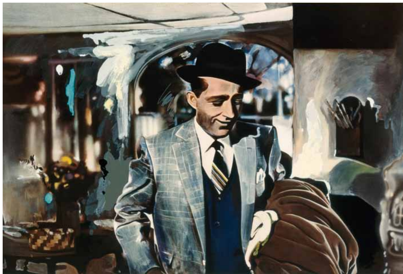
RICHARD HAMILTON Im Dreaming of a White Christmas 1967 (Kat. 20)