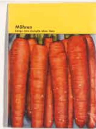
KP BREHMER Aufsteller 25 1967 (Kat. 11)

tischen Malerei mit größter Radikalität der Neukonstitution fotografisch erfasster Figuren- und Landschaftsmotive, die nun aus einzelnen »Lichtpunkten« gleichsam pointillistisch aufgebaut werden (Abb. S. 10). Das farbige Foto (in seiner Projektion als Diapositiv) wird in eine ganz neue Bildwirklichkeit überführt.