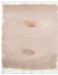
WVN 683, Ohne Titel , 1992, Pigmente, Öl und Gummi- arabikum auf Büttenpapier, 63 x 49 cm