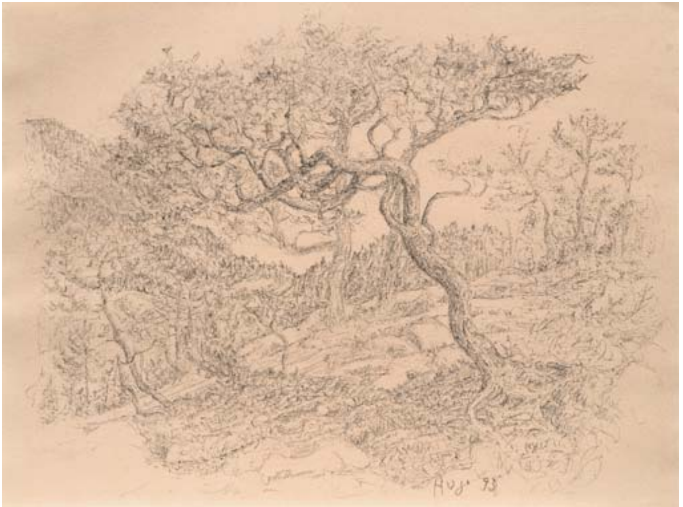
Ohne Titel , 1993, WVN 974 Ohne Titel , 1993, WVN 1216 Ohne Titel , 1993, WVN 1212