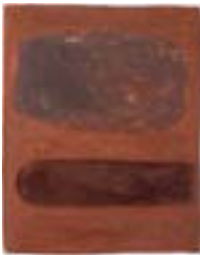
WVN 777, Ohne Titel , 1988, Pigmente, Öl und Gummiarabikum auf Papier, 32 x 25,5 cm Abb. S. 160