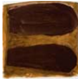
WVN 769, Ohne Titel , 1987, Pigmente, Öl und Gummiarabikum auf Papier, 31 x 31 cm Abb. S. 161