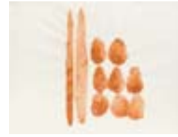
WVN 759, Spiel mit Stein und Holz , 1983, Pigmente und Gummiarabikum auf Büttenpapier, 48,5 x 63 cm, Privatbesitz, St. Ulrich Abb. S. 53