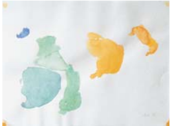
Aus der Ultner Landschaft , 1979, WVN 993 Ohne Titel , 1979, WVN 906 Aus Blau. Aus Rot , 1979, WVN 995