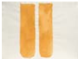
WVN 792, Ohne Titel , um 1982, Pigmente, Öl und Gummiarabikum auf Büttenpapier, 48 x 63 cm Abb. S. 60