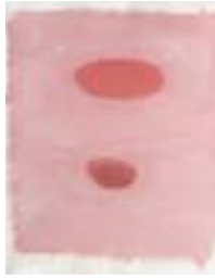
WVN 639, Ohne Titel , 1991, Pigmente, Öl und Gummi- arabikum auf Büttenpapier, 63 x 49 cm