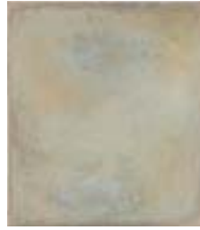
WVN 756, Ohne Titel , 1989, Pigmente und Gummiarabikum auf Leinwand, seitlich genagelt, 68 x 60 x 2 cm, Privatbesitz, St. Ulrich Abb. S. 115