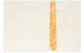
WVN 762, Ohne Titel , um 1982, Tempera, Aquarell auf Büttenpapier, 22 x 32 cm, Privatbesitz, St. Ulrich Abb. S. 56