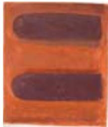
WVN 778, Ohne Titel , 1988, Pigmente, Öl und Gummiarabikum auf Papier, 35 x 29,5 cm Abb. S. 160