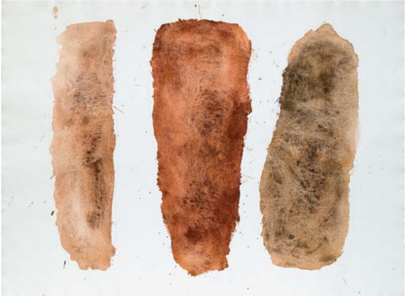
Ohne Titel , 1982/83, WVN 1050 Ohne Titel , 1987, WVN 1095 Ohne Titel , um 1981, WVN 856