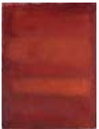
WVN 745, Ohne Titel , 1985, Pigmente, Öl und Gummi- arabikum auf Leinwand, seitlich genagelt, 61 x 46 x 2 cm, Privatbesitz, St. Ulrich