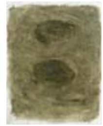
WVN 699, Ohne Titel , 1992, Pigmente, Öl und Gummi- arabikum auf Büttenpapier, 63 x 49 cm Abb. S. 157