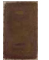
WVN 749, Ohne Titel , 1989, Pigmente, Öl und Gummi- arabikum auf Leinwand, seitlich genagelt, 64 x 38,5 x 2 cm, Privatbesitz, St. Ulrich Abb. S. 102