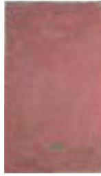
WVN 751, Ohne Titel , 1989, Pigmente, Öl und Gummiarabikum auf Leinwand, seitlich genagelt, 54 x 32 x 2 cm, Privatbesitz, St. Ulrich Abb. S. 115