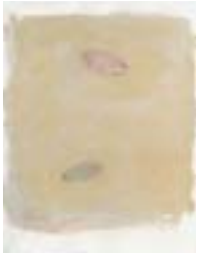
WVN 638, Ohne Titel , 1991, Pigmente, Öl und Gummi- arabikum auf Büttenpapier, 63 x 49 cm Abb. S. 153