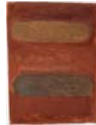
WVN 771, Ohne Titel , 1988, Pigmente, Öl und Gummiarabikum auf Papier, 39 x 29 cm Abb. S. 162