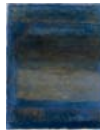
WVN 748, Ohne Titel , 1988, Pigmente, Öl und Gummi- arabikum auf Leinwand, seitlich genagelt, 63 x 52 x 2 cm, Privatbesitz, St. Ulrich Abb. S. 110