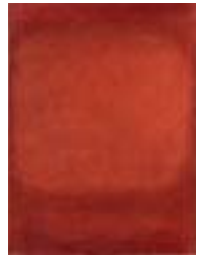
WVN 742, Ohne Titel , 1984, Pigmente, Öl und Gummi- arabikum auf Leinwand, seitlich genagelt, 80 x 60 x 2 cm, Privatbesitz, St. Ulrich Abb. S. 95