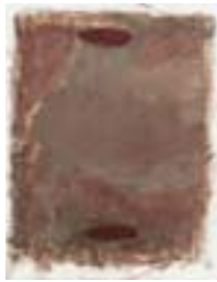
WVN 714, CUÉCNES , nicht datiert, Pigmente, Öl und Gummiarabikum auf Bütten- papier, 63 x 49 cm