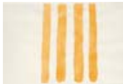
WVN 765, Ohne Titel , um 1982, Tempera auf Büttenpapier, 22 x 32 cm, Privatbesitz, St. Ulrich Abb. S. 56