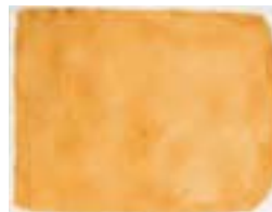
WVN 793, Ohne Titel , 1982, Pigmente, Öl und Gummiarabikum auf Büttenpapier, 48 x 63 cm