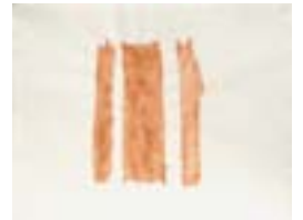
WVN 785, Aus Drei gepaart , 1883, Pigmente, Öl und Gummiarabikum auf Büttenpapier, 48 x 63 cm Abb. S. 58