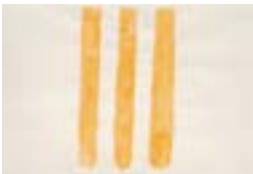
WVN 764, Ohne Titel , um 1982, Tempera auf Büttenpapier, 22 x 32 cm, Privatbesitz, St. Ulrich Abb. S. 56