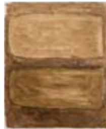
WVN 779, Ohne Titel , 1988, Pigmente, Öl und Gummiarabikum auf Papier, 40 x 49 cm Abb. S. 161