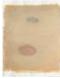
WVN 663, Ohne Titel , 1991, Pigmente, Öl und Gummi- arabikum auf Büttenpapier, 63 x 49 cm