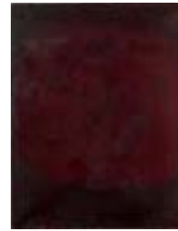
WVN 743, Ovale Naturform , 1984, Pigmente, Öl und Gummi- arabikum auf Leinwand, seitlich genagelt, 94 x 75 x 2 cm, Privatbesitz, St. Ulrich