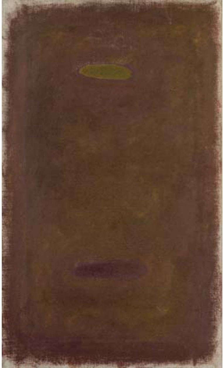
Ohne Titel , 1989, WVN 23 Ohne Titel , 1989, WVN 749