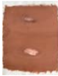
WVN 684, Ohne Titel , 1992, Pigmente, Öl und Gummi- arabikum auf Büttenpapier, 63 x 49 cm Abb. S. 155