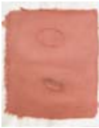
WVN 710, Ohne Titel , nicht datiert, Pigmente, Öl und Gummiarabikum auf Bütten- papier, 63 x 49 cm