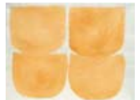
WVN 799, Ohne Titel , 1982, Pigmente, Öl und Gummiarabikum auf Büttenpapier, 48 x 63 cm Abb. S. 65