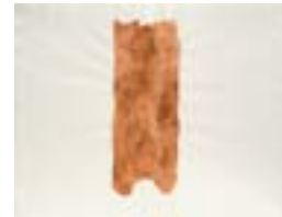
WVN 781, Ohne Titel , 1983, Pigmente, Öl und Gummiarabikum auf Büttenpapier, 48 x 63 cm