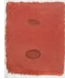
WVN 669, Ohne Titel , 1991, Pigmente, Öl und Gummi- arabikum auf Büttenpapier, 63 x 49 cm Abb. S. 155