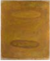
WVN 750, Ohne Titel , 1988/89, Pigmente, Öl und Gummiarabikum auf Leinwand, seitlich genagelt, 50 x 41 x 2 cm, Privatbesitz, St. Ulrich Abb. S. 109