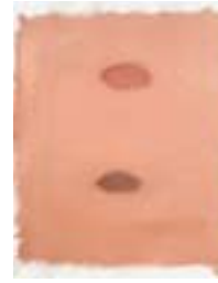
WVN 664, Existentiell Ulli C , 1991, Pigmente, Öl und Gummi- arabikum auf Büttenpapier, 63 x 49 cm Abb. S. 154