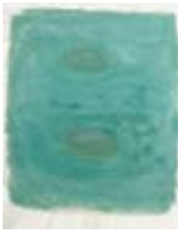
WVN 680, Ohne Titel , 1992, Pigmente, Öl und Gummi- arabikum auf Büttenpapier, 63 x 49 cm Abb. S. 156