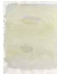
WVN 694, Ohne Titel , 1992, Pigmente, Öl und Gummi- arabikum auf Büttenpapier, 63 x 49 cm