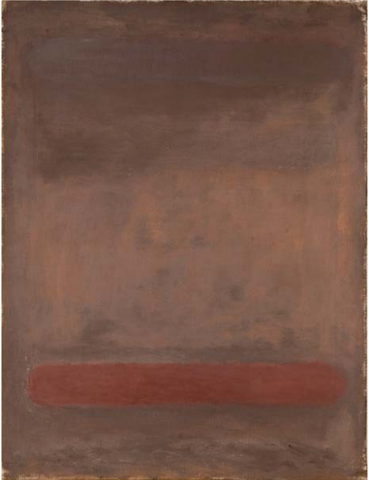
Naturform , 1988, WVN 821