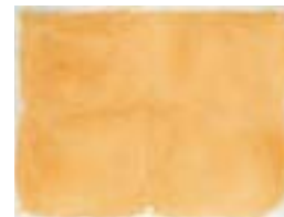
WVN 794, Ohne Titel , 1982, Pigmente, Öl und Gummiarabikum auf Büttenpapier, 48 x 63 cm Abb. S. 65