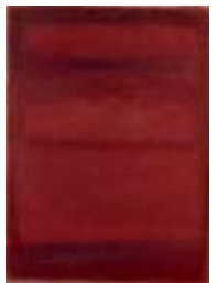
WVN 746, Ohne Titel , 1987, Pigmente, Öl und Gummi- arabikum auf Leinwand, seitlich genagelt, 75 x 55 x 2,4 cm, Privatbesitz, St. Ulrich Abb. S. 101