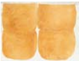
WVN 790, Ohne Titel , 1982, Pigmente, Öl und Gummiarabikum auf Büttenpapier, 48 x 63 cm