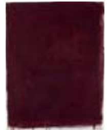
WVN 776, Ohne Titel , 1986, Pigmente, Öl und Gummiarabikum auf Packpapier, 49 x 37 cm Abb. S. 162