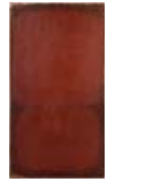
WVN 744, Ohne Titel , 1984, Pigmente, Öl und Gummi- arabikum auf Leinwand, seitlich genagelt, 90 x 49 x 2 cm, Privatbesitz, St. Ulrich