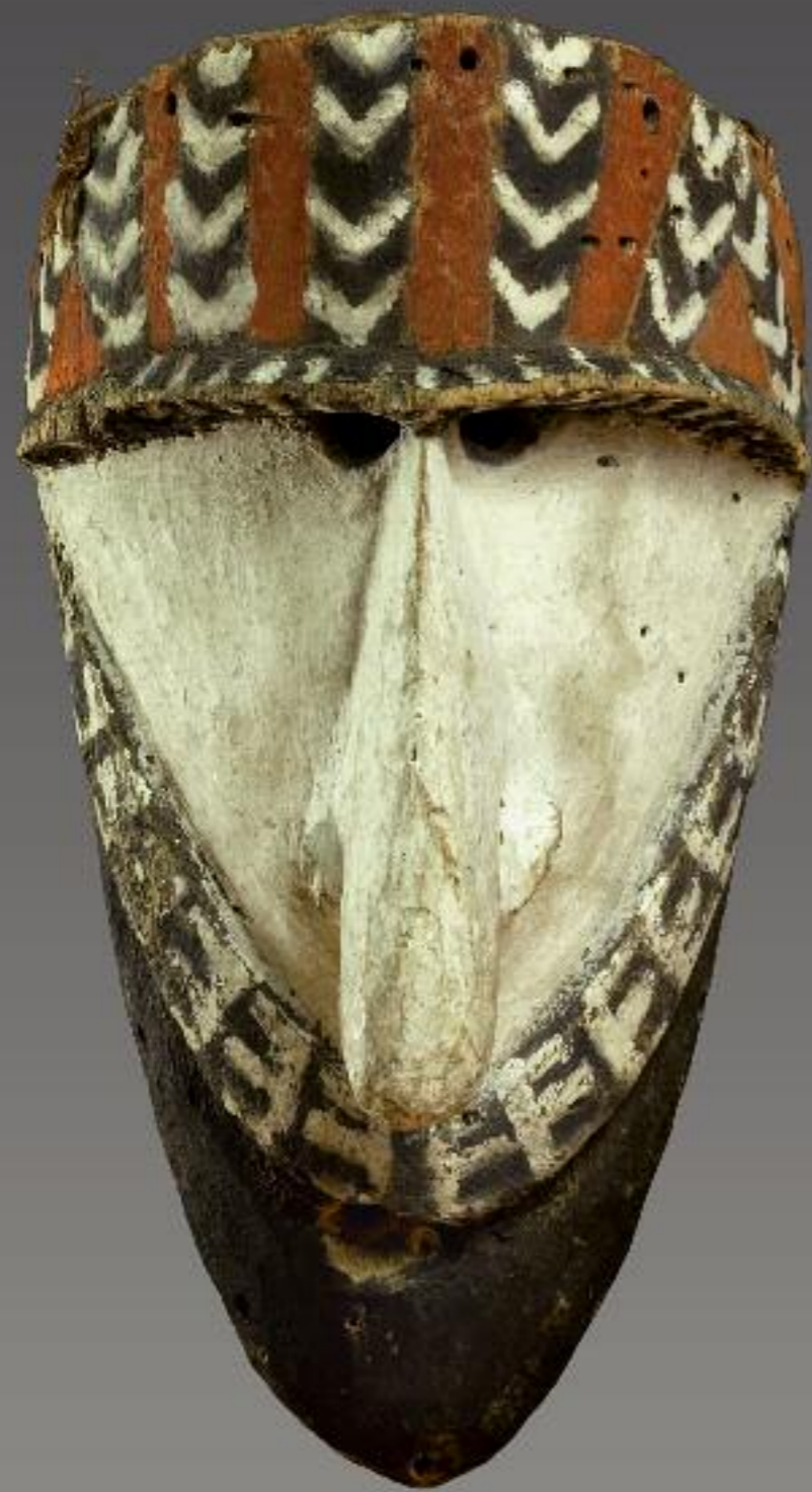
Malekula, Vanuatu, Melanesien, 19. Jh. Holz, Farbe; H 26 cm RJM 31254