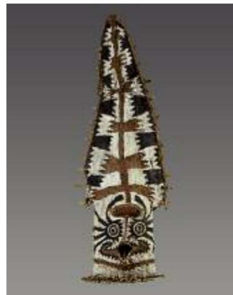
Elema, Papua-Golf, Papua-Neuguinea, Melanesien, frühes 20. Jh. Rindenbast, Pflanzenrohr, Farbe; H 132,5 cm RJM 35759