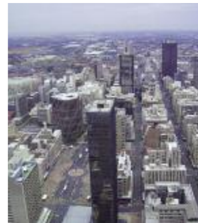
Johannesburg, Südafrika, 2004