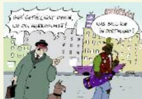
Cartoon, Tom, 2002

Solange sich die in der Kolonialzeit konstruierten Afrikabilder halten, wird sich in den Köpfen der Menschen kaum etwas ändern. Solange aber wird auch der latente oder offene Rassismus gegen Menschen afrikanischer Herkunft nicht verschwinden.