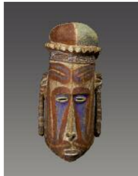
Witu-Inseln, Papua-Neuguinea, Melanesien, um 1900 Holz, Farbe; H 59,5 cm RJM 20767