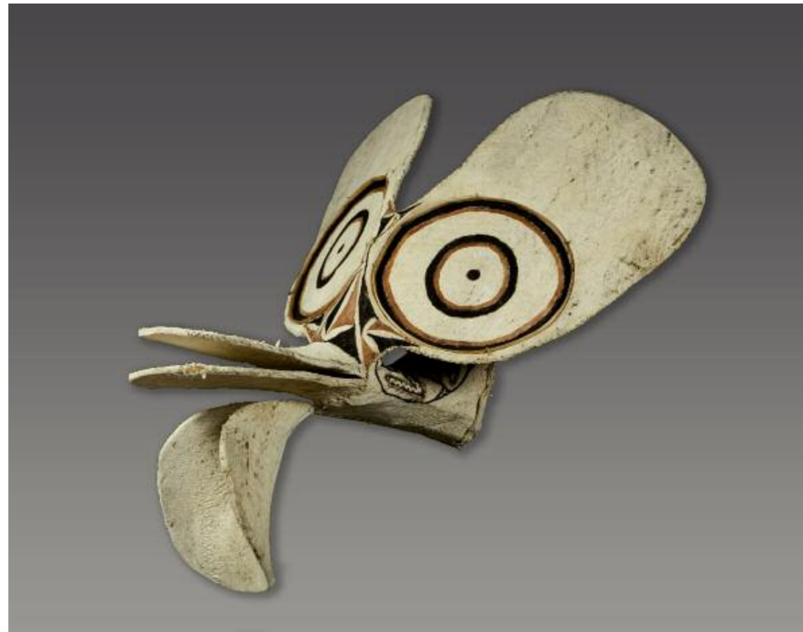
Kavat-Maske Uramot-Baining, Neubritannien, Ozeanien, 20. Jh. Rindenbaststoff, Rotang; H 111 cm RJM 53002

Kavat -Masken treten bei dem nächtlichen Feuertanz der Baining auf. Nach Einbruch der Dunkelheit erscheinen die schwarz und weiß bemalten und mit Büscheln aus Blattwerk geschmückten Maskenträger auf dem Tanzplatz. Begleitet von Gesang und dem Rhythmus von