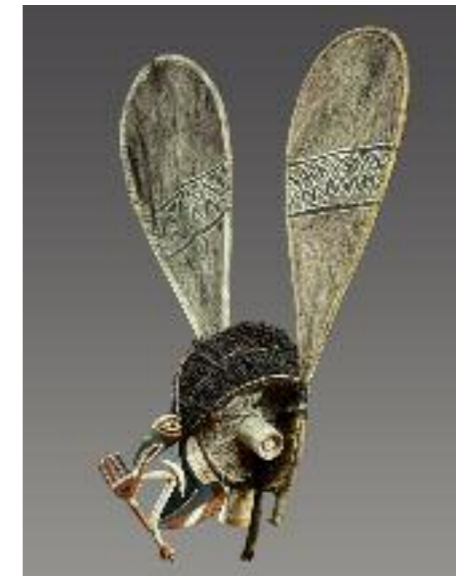
Nördliches Neuirland, Papua-Neuguinea, Melanesien, 19. Jh. Holz, Rindenbaststoff, Pflanzenfaser; H 107,5 cm RJM 4442