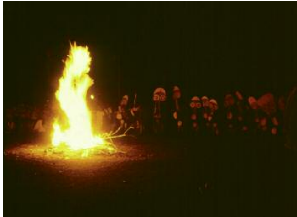
Nachttanz der Uramot-Baining Gaulim, Neubritannien, Ozeanien, 1982

Die Initiation der Jungen ist nicht der einzige Anlass für einen Feuertanz. Heute wird er zudem auch im Rahmen von Gemeinschaftsprojekten, an Festtagen und für Touristen aufgeführt.