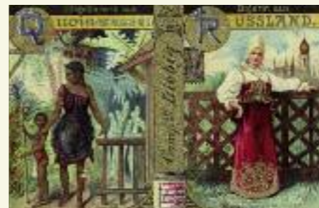
Liebig-Sammelbilder Serie 387, Bild 12, 1898 Serie 449, Bild 9, 1900

Sammelbilder trugen Ende des 19. Jahrhunderts zur Verbreitung romantisierender Klischees von ›Völkern‹ und ›Rassen‹ bei. Auf subtile Weise unterstützten sie so die Idee einer hierarchischen Unterteilung der Menschheit.