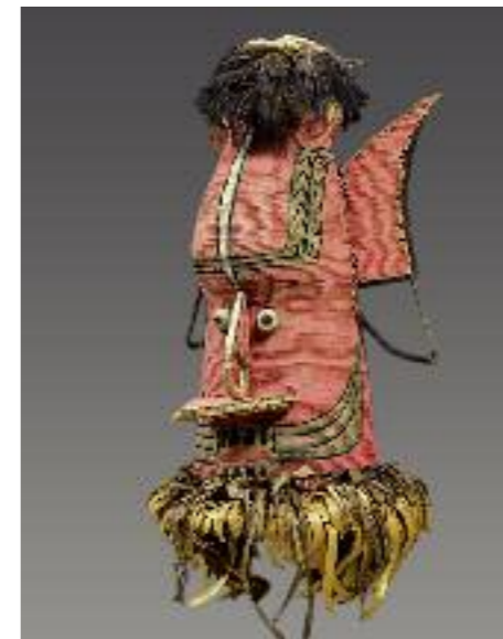
Sulka, Neubritannien, Papua-Neuguinea, Melanesien, frühes 20. Jh. Pflanzenrohr, Pflanzenmark, Kasuarfedern; H 73 cm Restauriert mit Mitteln des Landes Nordrhein- Westfalen und der Stadt Köln, 2008 RJM 24802