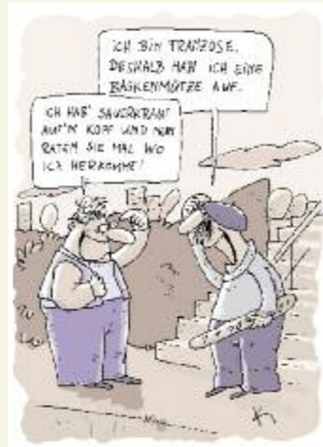
Cartoon, Matthias Kiefel, 2007

Die moderne Genetik hat die Einteilung der Menschheit in ›Rassen‹ widerlegt. Genetisch betrachtet können sich zwei Menschen aus verschiedenen Konti-