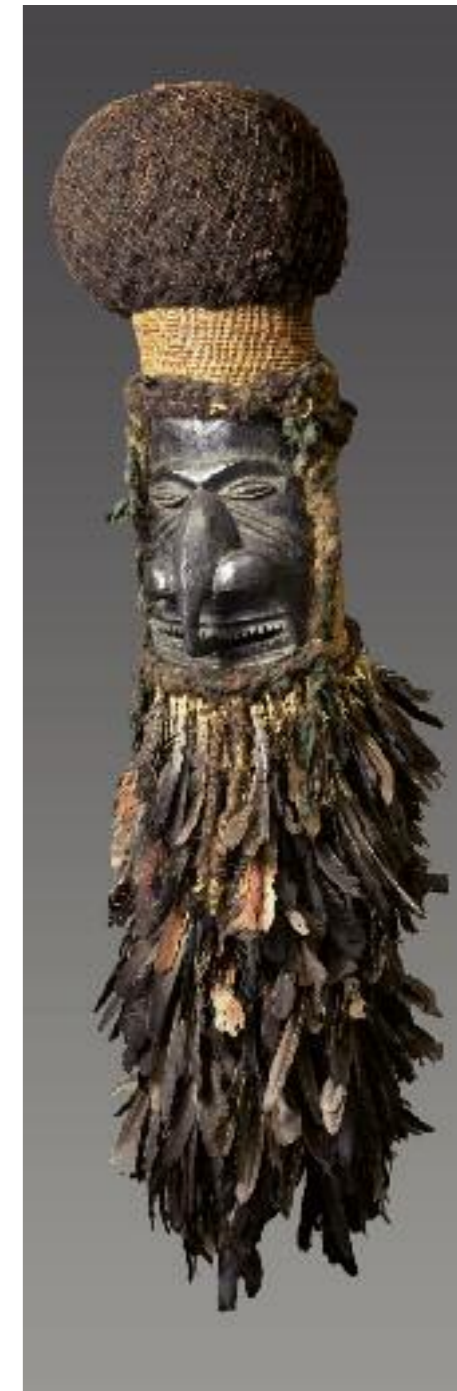
Neukaledonien, Melanesien, um 1900 Holz, Federn, Menschenhaar; H 140 cm Restauriert mit Mitteln der Börner-Stiftung, Köln RJM 19879