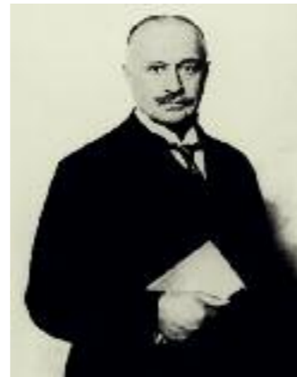
Max von Oppenheim