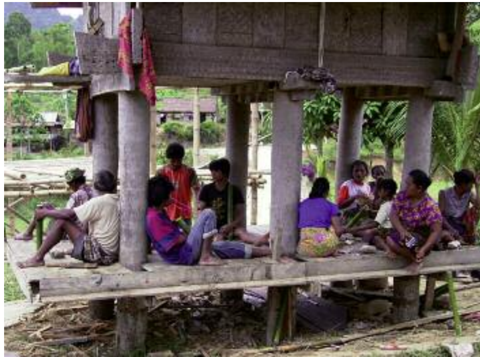
Mußestunde im Schatten des Reisspeichers Gantiri, Tana Toraja, Indonesien, Südostasien, 2007

In den Siedlungen der Toraja bilden Wohnhaus und Reisspeicher eine Einheit: Das Haus hat privaten Charakter und wird als ›Mutter‹ bezeichnet; auf der Plattform des ›Vater‹ genannten Speichers versammelt man sich, um gemeinsam zu arbeiten, zu feiern und zu ruhen. Hier werden auch Gäste empfangen und bewirtet, Neugeborene öffentlich willkommen heißen und Verstorbene verabschiedet. Haus und Speicher sind das soziale und religiöse Zentrum des Familienverbandes rapu . Die Anzahl, Größe und Ausstattung der Gebäude bezeugt den Reichtum, Status und das traditionelle Weltbild der Gemeinschaft. Reiche Schnitzereien und farbige Bemalung sind das Privileg ranghoher Familien.