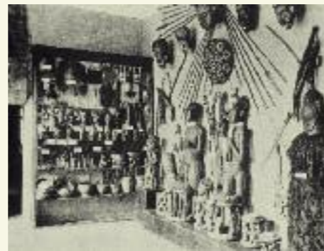
Postkarte, Kamerun-Ausstellung, 1906 Museum für Völkerkunde Frankfurt

Die Sammlungen in deutschen Völkerkundemuseen enthalten überproportional viele Waffen, die meist während der Kolonialzeit gesammelt wurden. Präsentiert als ›Waffenfächer‹ schürten sie das Klischee des ›wilden‹ Afrikaners.