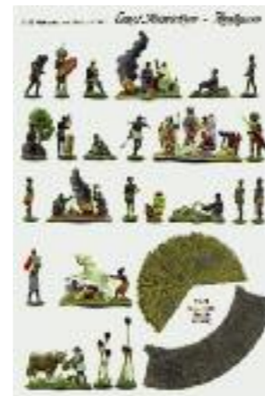
Figurengruppe »Afrikanisches Dorf« Deutschland, 2008 nach einem Vorbild um 1890 Zinn, Pigment; H max. 3 cm RJM 63885

Ende des 19. Jahrhunderts wurde die koloniale Aneignung unter anderem mit der vermeintlichen Rückständigkeit des afrikanischen Kontinents gerechtfertigt. Das aus Strohütten bestehende Dorf wurde als typische afrikanische Siedlungsform dargestellt. Afrikanische Strohüttdörfer zierten schon früh Objekte der deutschen Alltagskultur. Daran hat sich bis heute wenig geändert. »Folklore« dominiert die Darstellung Afrikas: Mit einem aktuellen Stickerheftchen kann man sich sein »authentisches« afrikanisches Dorf basteln, das sich kaum von seinen gut 100 Jahre älteren Vorgängern aus Zinn unterscheidet. Heute wie damals entsprechen die Objekte keinem realen Dorf in einem bestimmten afrikanischen Land, sondern sind der Phantasie der europäischen Schöpfer entsprungen. Das moderne Afrika kommt auch in den Medien kaum vor, wenngleich Großstädte wie Lagos oder Johannesburg mit ihren Hochhäusern, ihrem Verkehr und ihrer Millionenbevölkerung den europäischen Metropolen in nichts nachstehen.