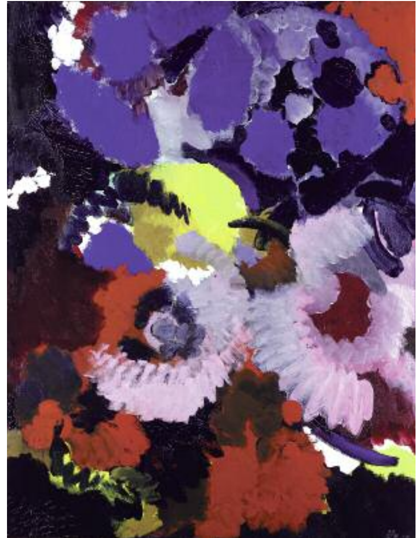
Ernst Wilhelm Nay (1902-1968): Akkord in Rot und Blau , 1958, Inv.-Nr.: HK-5026