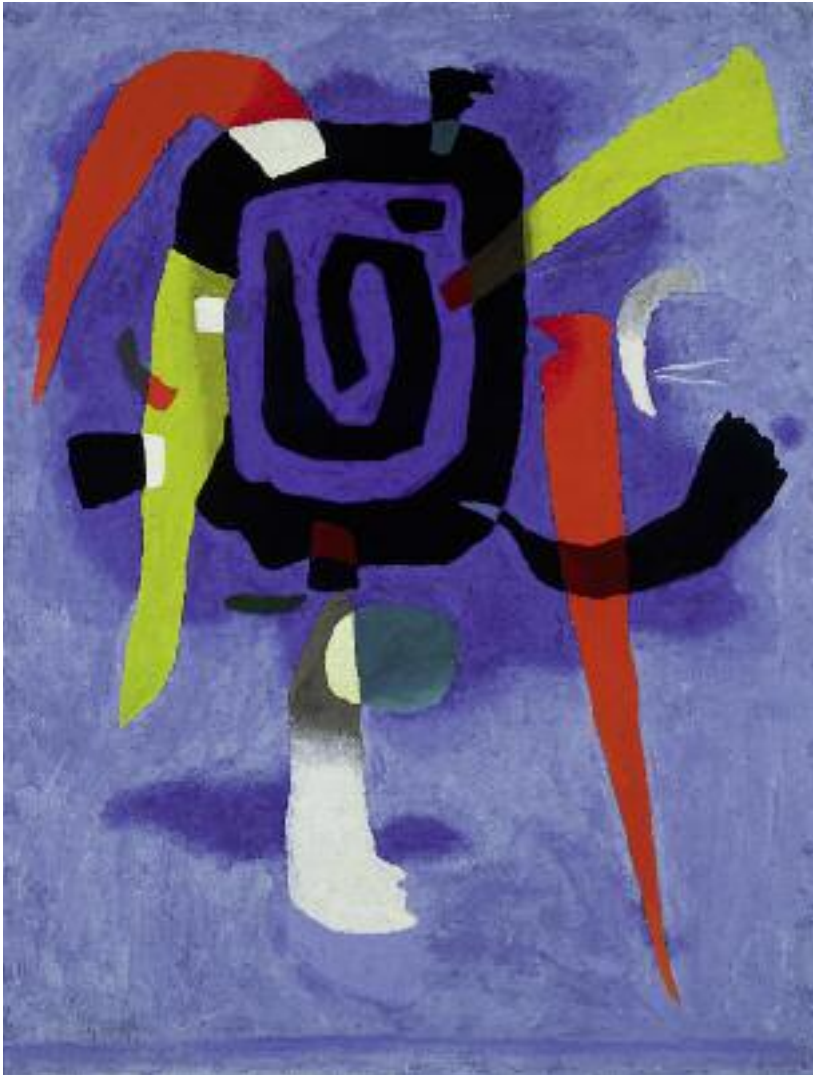
Willi Baumeister (1889-1955), Bluxao V , 1955, Inv.-Nr.: HK-5051