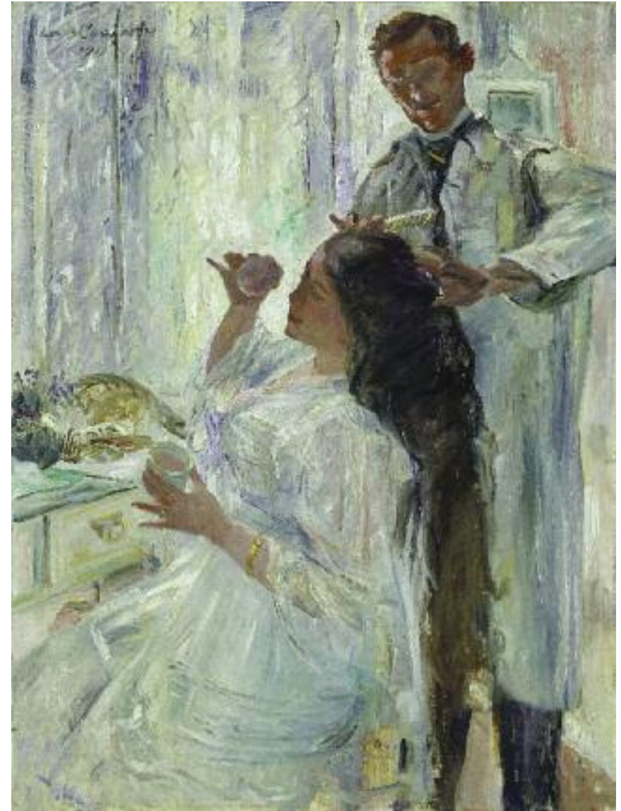
Lovis Corinth (1858-1925): Charlotte Corinth am Frisiertisch (Am Putztisch) , 1911, Inv.-Nr.: HK-1857