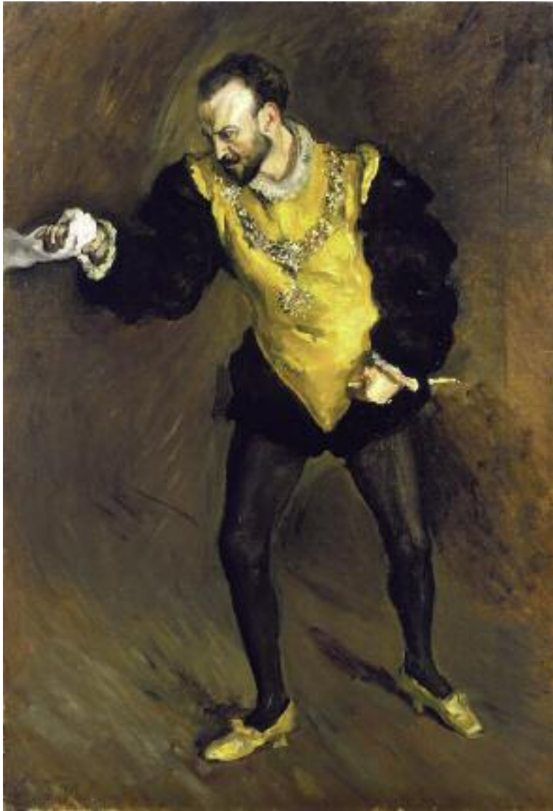
Max Slevogt (1868-1932): Der schwarze d'Andrade , 1903, Inv.-Nr.: HK-5149