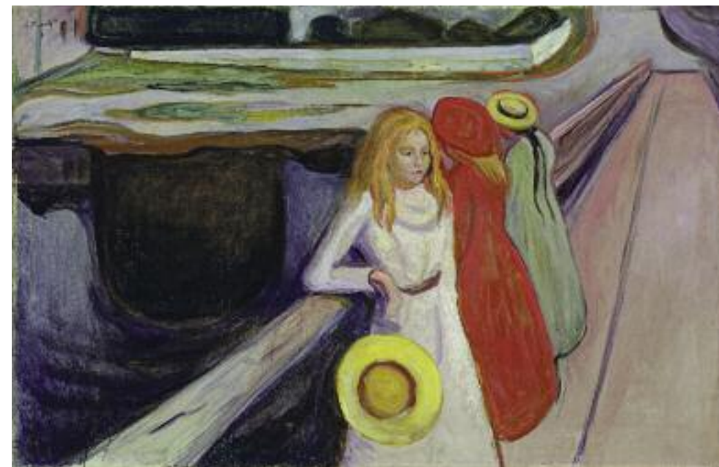
Edvard Munch (1863-1944): Mädchen auf der Brücke , 1901, Inv.-Nr.: HK-5052